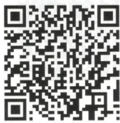
QR-Code Navigation Zuschauerpunkt 6 (Z6)